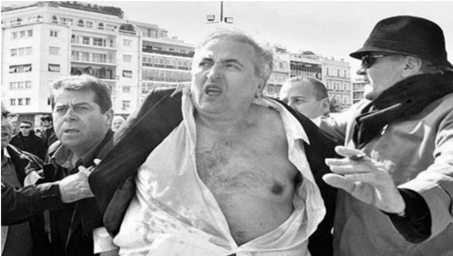
Αλυσμόντες κλωτσιές και καφέδες στον πωλημένο πρόεδρο της ΓΣΕΕ το 2010.

«Σαράντα σβέρκοι βοδινοί με λαδωμένες μπούκλες, σκεμπέδες σταυροθόλωτοι και βρόμιες ποδα- ρούκλες, ξετσιώπτες, ακαμάτηδες, τσιμπούρια και κορέοι ντυμένοι στα μαλάματα κι επίσημοι κι ωραίοι. [...]