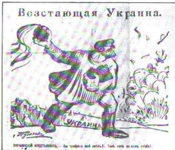
ΕΞΕΓΕΡΜΕΝΗ ΟΥΚΡΑΝΙΑ ΟΥΚΡΑΝΟΣ ΧΩΡΙΚΟΣ: "Θέλετε τό ψωμί μου; Γάρτε ψωμί!" (Υπογραφή: Πουγκατσέρ)