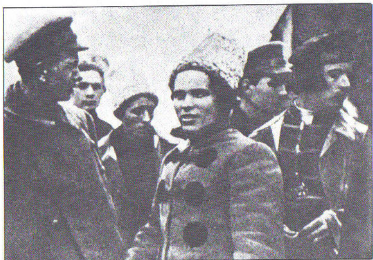
Ο Νέστορ Ιβάνοβιτς Μάχνο στό στρατηγείο του, στό χωριό Γκιουλάι Πολέ. Κάτω αριστερά: ο Φιοντόρ Στσιούς, υπαρχηγός του αναρχικού στρατού τών Εξεγερμένων. Δεξιά ο Ταρανόβσκη, διοικητής τής εβραϊκής μεραρχίας του Γκιουλάι Πολέ. Αργότερα έγινε αρχηγός του Επιτελείου του Μάχνο.