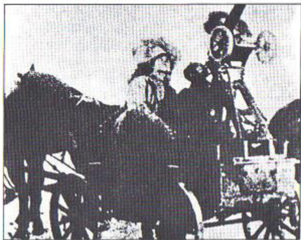
Κάρο μεταφοράς σασού που ο Μάχνο είχε μετατρέψει σε όργανο μάχης εξοπλιζοντάς το με πολυβόλο.

Η σημαία του στρατού του Μάχνο. Φέρει την επιγραφή "Ελευθερία ή Θάνατος" στην Ουκρανική γλώσσα. ►