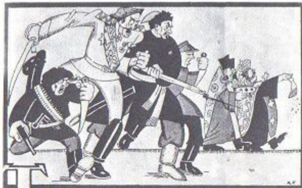
Μπολσεβίκικη αφίσσα που εξομοώνει τό Μάχνο (αριστερά) με τό Βρόνγκελ, τόν Πετλιούρα και τήν Εκκλησία, μια και όλοι τους είναι εχθροί του σοβιετικού κράτους.