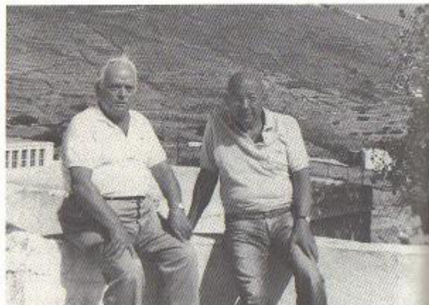
Με τον Κορνήλιο Καστοριάδη στο σπίτι του στην Τήνο.

είχε αλληλεγγύη. Όταν κάναμε απεργίες, βοηθούσαν και οι εργάτες από τα άλλα επαγγέλματα, κατέβαιναν στην απεργία σε συμπαράσταση του άλλου κλάδου, κάνανε εράνους και βοηθούσαν. Όταν δημιουργήθηκαν τα λεγόμενα εθνικοαπελευθερωτικά κινήματα, χάθηκε αυτή η ζεστασιά. Άρχισαν όλοι να λένε ότι πρέπει να φύγει ο κατακτητής για να ζήσουν καλύτερα, οπότε διώξαν τους γερμανούς κατακτητές και φέρανε τους έλληνες κατακτητές, αντί να κάνουν κοινωνική επανάσταση και κοινωνική αλλαγή. Έτσι χειροτέρευσαν τα πράγματα: άρχισαν οι επιτροπές ασφαλείας, τα πιστοποιητικά κοινωνικών φρονημάτων, ήλθε η Δεξιά.