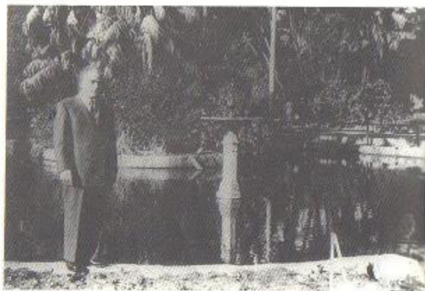
Στο Βοτανικό Κήπο του Σίδνεϊ.

Οι Αυστραλοί θέλουν ψάρι χωρίς κόκαλο. Έτσι όπως είναι φιλεταρισμένο, το βάζουν μέσα στο τρώφι, βράζει το καζάνι με λίπος, προσθέτουν και κάρυ και το τρώνε. Στις παραλίες όλοι οι Έλληνες και οι Ιταλοί έχουν ψαράδικα και fish'n'chips, μαγαζιά που τηγανίζουν ψάρια και πατάτες. Ο κόσμος πάει και ψωνίζει από κει.