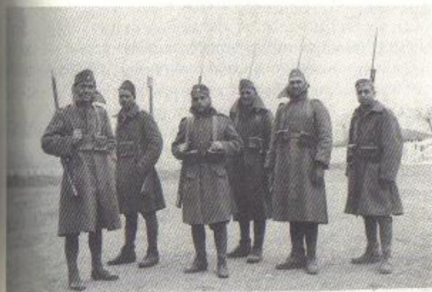
Περυπολία στο 50ο Σύνταγμα (τρίτος από αριστερά).

Φεύγω, πάω σπίτι κι αυτοί μου έβγαλαν αναφορά ότι “ελεύθερος ιατρού ων, εξήλθον του στρατιώνος” . Ο συνταγματάρχης Κωνσταντίνος Μαυρομάτης, ένας δεξιός –βρισκόμαστε επί πρωθυπουργίας Τσαλδάρη– με άκουσε να χαιρετώ “Ταυτάκος Ιωάννης” και να λέω την ιστορία με το οινόπνευμα. Λύσσαξε ο συνταγματάρχης, σου λέει, το σύνταγμά μου να μην έχει οινόπνευμα στο αναρρωτήριο! Αντίς να με τιμήσει γι’ αυτό, επειδή τον ρεζίλεψα, με πιάνει από το χιτώنيο –το είχα μεταποιήσει εγώ στο ράφτη για να μου στέκεται κα-