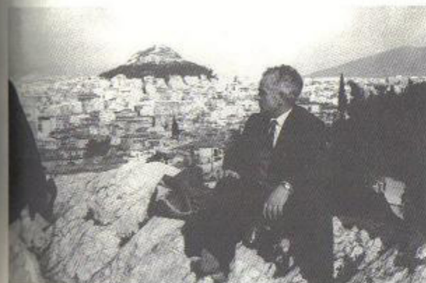
Γύρω στο 1985 πάνω στο λόφο του Φιλοπάππου.