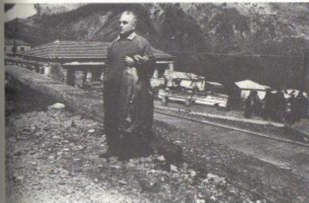
Στα Μετέωρα, στη δεκαετία του '70.

Ο Στίνας είχε κάνει σωστή εκτίμηση. Και πράγματι σε μια βδομάδα κηρύχθηκε η δικτατορία του Παπαδόπουλου, οπότε βλέπω το Λουκά και του λέω ειρωνικά: "Είδες; Έγινε η δικτατορία του προλεταριάτου που έλεγες!"