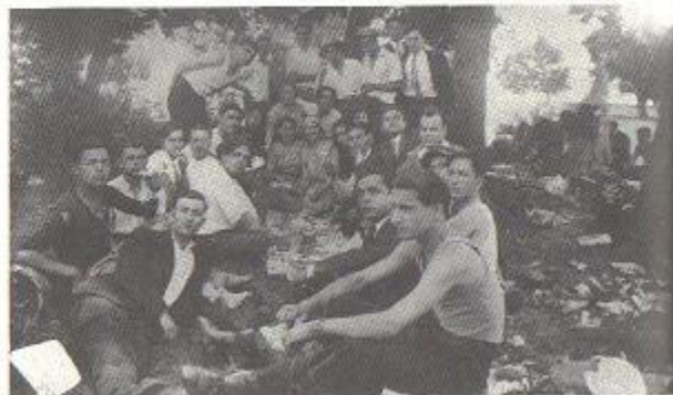
Από εκδρομή το 1928 στο Τέκελι, στη Σίνδο. Πολλοί σύντροφοι και Κληνεργάτες Εβραίοι.