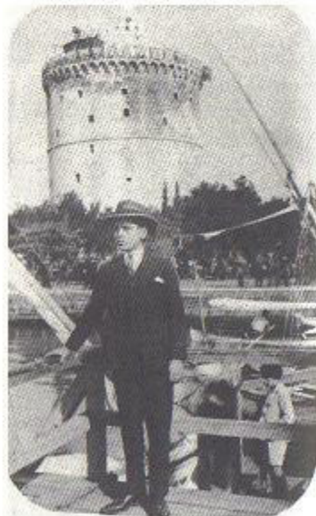
20 χρόνων τσαγκάρης, μπροστά στο Λευκό Πύργο.

Το σπίτι που αγοράσαμε ήταν στο Κουλέ Καφέ, στο τέρμα Ηροδότου, εκεί που είναι ο Άγιος Νικόλαος ο Ορφανός, κοντά στην πλατεία Τερψιθέας. Εκεί καθίσαμε και συν τω χρόνω ανξηθήκαμε και πληθύναμε, σκορπίσαμε δεξιά-αριστερά, παντρεύτηκαν τ' αδέρφια μου κι οι αδερφές μου, η οικογένεια μεγάλωσε. Εγώ έγινα τσαγκάρης, έμαθα μια τέχνη. Τότε λέγαμε μάθε τέχνη κι άστηνε κι αν πεινάσεις πιάστηνε . Ο τεχνίτης όμως είναι πάντα πεινασμένος. Οπότε εμείς το είχαμε μετατρέψει και λέγαμε μάθε τέχνη για να ζήσεις και εμπόριο να πλουτίσεις!