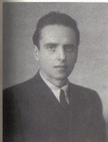
Γιώργος Βιστώρης, έπαιζε στο θίασο της Κοτοπούλη. Πήρε μέρος στην Εθνική Αντίσταση στη Γαλλία και πέθανε εκεί.

Τότε κυριαρχούσε η αντίληψη ότι δεν έπρεπε να κάνουμε υποχωρήσεις απέναντι στην αστική τάξη. Μία Εβραία, κόρη πλουσιού βιομηχάνου, που πήγε να την απελευθερώσει ο πατέρας της από τις νέες φυλακές εδώ, η Ορσοζιλ, δεν θέλησε τη χαριστική μεσολάβηση. Είχε σχετιστεί με κάποιες συντρόφισσες αργειομαρξίστριες, την Αμαλία Δελή, την Κοτσάμπασα και άλλες και ήταν καταδικασμένες αυτές από το λεγόμενο Σχολείο της Αγίας Φωτεινής. Αυτή είπε, λοιπόν, στον πατέρα της: "Συχαίνομαι την τάξη σας και τα μέσα που μεταχειρίζεστε! Εγώ θα μείνω με τις συντρόφισσές μου!". Και πράγματι έμεινε στη φυλακή. Ενώ ο Ράπτης... Ορισμένοι αδύνατοι χαρακτήρες, βέβαια, κάνανε μετάνοιες αργότερα στην Αζρουνάπλια για να γλυτώσουν —άλλη περίπτωση αυτή όμως.