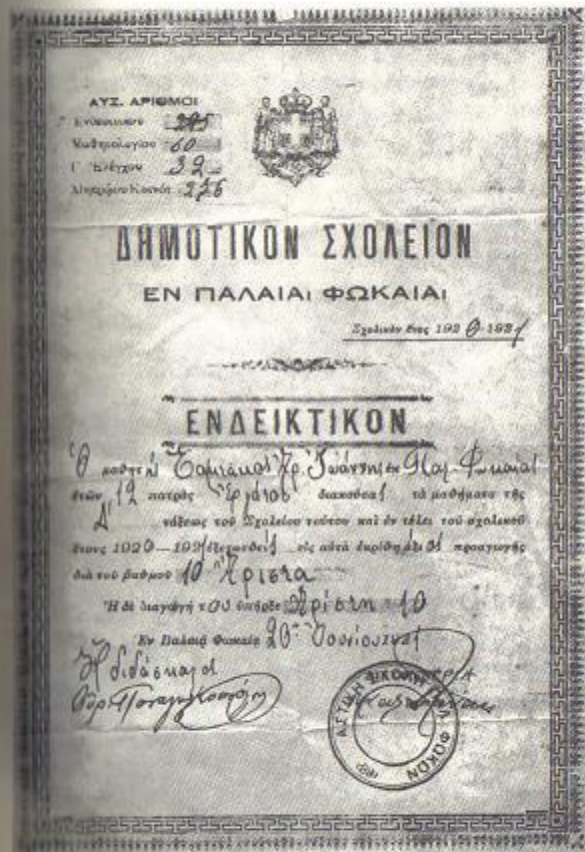
Η τελευταία σχολική χρονιά: το ενδεικτικό της Δ' Δημοτικού του 1921.