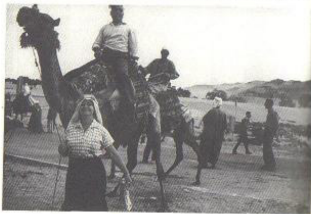
Με το φέσι πάνω στην καμήλα.

Εκεί στην Αυστραλία έμαθα και για τον Μπελογιάννη. Αυτός είχε διαφωνήσει τότε με την επίσημη ηγεσία, με το Ζαχαριάδη, και τον στέλνανε σε επικίνδυνες αποστολές στην