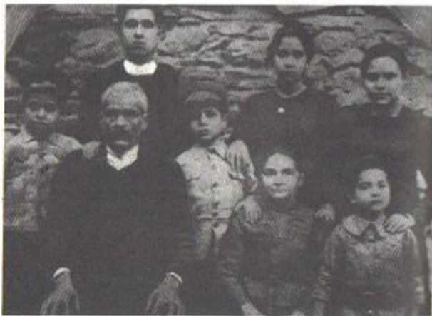
Η οικογένειά μου όλη από το προσφυγικό βιβλιόριο του 1919 που παλινοστήσαμε στη Μικρά Ασία. Είμαι στο μέσο της φωτογραφίας. Στην κοιλιά της μίνας ένα παιδί που πέθανε.

Η Ευαγγελική Σχολή της Σμύρνης ήταν όπως η Μεγάλη του Γένους Σχολή στην Κωνσταντινούπολη. Σπουδάζες εκεί διάφορες επιστήμες. Αλλά έγινε ο διωγμός κι εγώ πού να