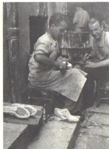
Στο εργοστάσιο του Μεταξά στη Χαριλάου Τρικούπη, μ' έναν άλλο τσαγκάρη. Είναι καλοκαίρι και δουλεύουμε έξω. Γύρω στο 1950.

Αυτή είναι και η δική μου άποψη. Ύστερα από τις προδοσίες του σταλινισμού και τη χρεωκοπία της θεωρίας του εκφυλισμένου εργατικού κράτους, ύστερα από τη συμφωνία Χίτλερ-Στάλιν και το διαμελισμό της Πολωνίας, εμάς πλέον άρχισαν να μας χωρίζουνε ζητήματα αρχής και από τον ίδιο τον Τρότσκι και από τους τροτσκοιστές γενικά, οι οποίοι παρέμειναν κολλημένοι στη θεωρία του εκφυλισμένου εργατικού κράτους, που προσπαθούσαν να μεταρρυθμίσουν. Θεωρούσαμε ότι αυτοί δεν ήταν προδότες συνειδητά, αλλά ότι ήταν εσφαλμένες οι εκτιμήσεις τους. Και ο Τρότσκι ήταν συναισθηματικά δεμένος μ' αυτούς, επειδή πήγε μέρος στην οκτωβριανή επανάσταση και δεν ήθελε να ξεχωρίσει τον εαυτό του από το δημιούργημά του. Κι έτσι, παρ' όλες αυτές τις προδοσίες του σταλινισμού, εξακολουθούσε να έχει την αυταπάτη ότι εί-