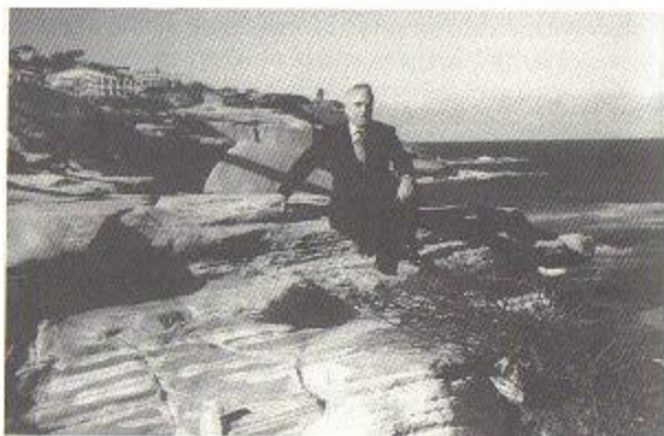
Αυστραλία, 1962, στο αερογιάλι Μπλοντά Μπιτς.